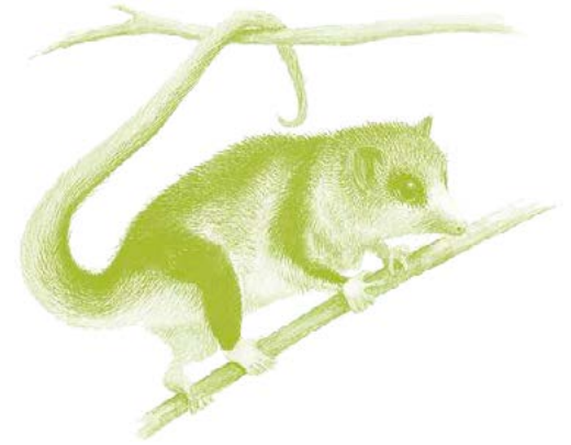
Monito del Monte - Dromiciops gliroides

Contacto de Emergencia / Fines de Semana: +56 9 447 26646