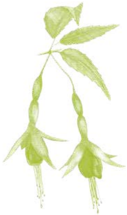
Chilco - Fuchsia magellanica